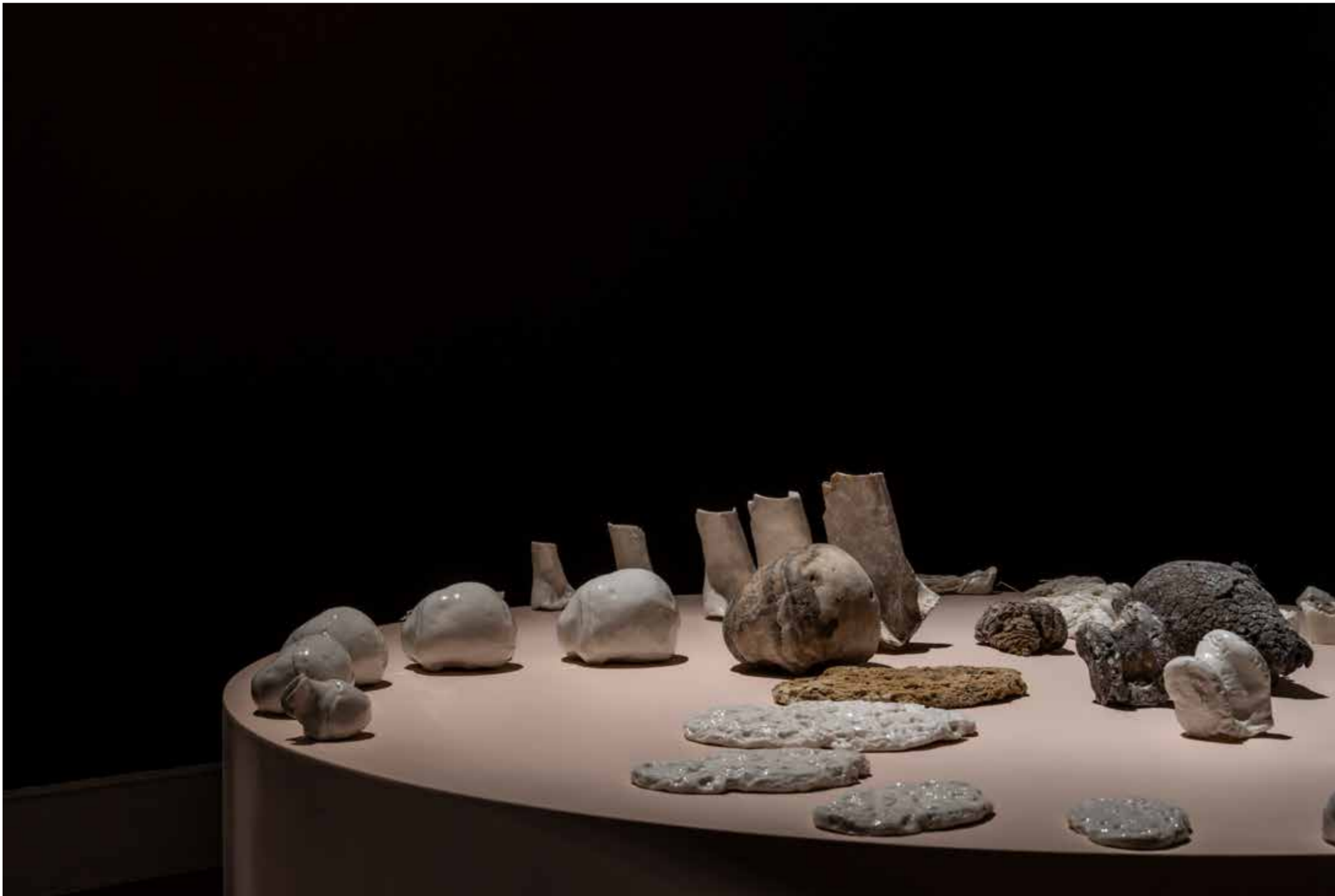
Girdap. 2024, Enstalasyon, buluntu nesnelere ve porselene, değişken boyutlar