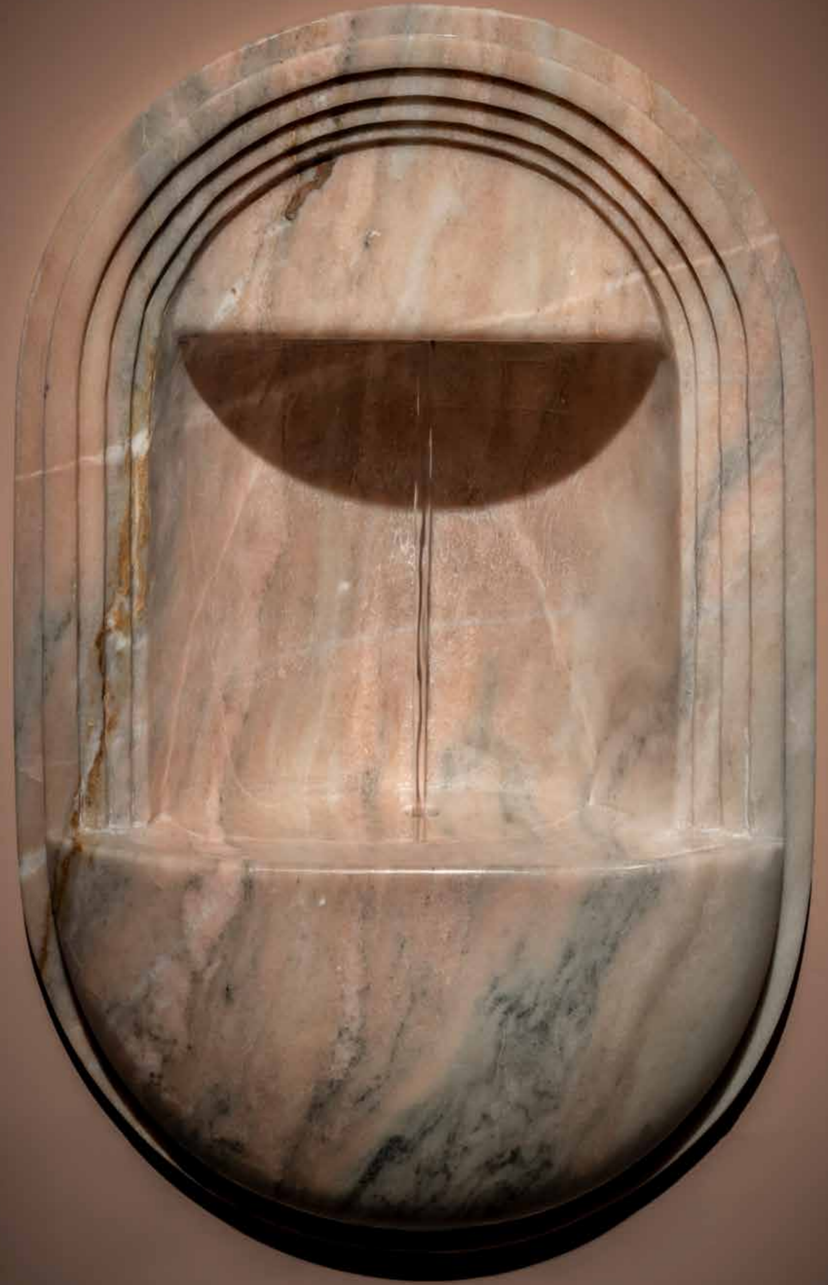
273.15°C ya da Ne Üstünde Işık Ne Altında Karanlık.